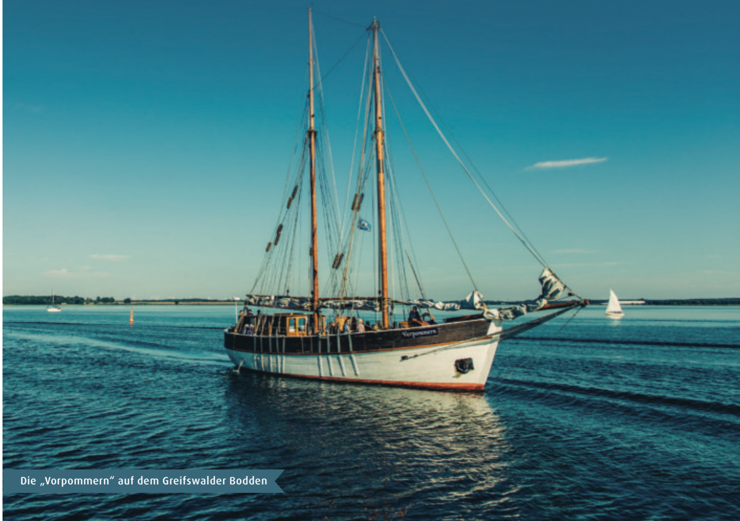
Die „Vorpommern“ auf dem Greifswalder Bodden

Kommen Sie an Bord! Greifswald ist eine Stadt am Meer. Zwar spürt man das maritime Erbe der Hansestadt bereits bei einem Spaziergang im Museumshafen, richtig erlebbar wird die Hansestradition jedoch erst an Bord eines Segelschiffes. Sowohl das Flaggschiff der Stadt, die SSS Greif, als auch die Schiffe des Museumshafens nehmen Gäste mit an Bord.