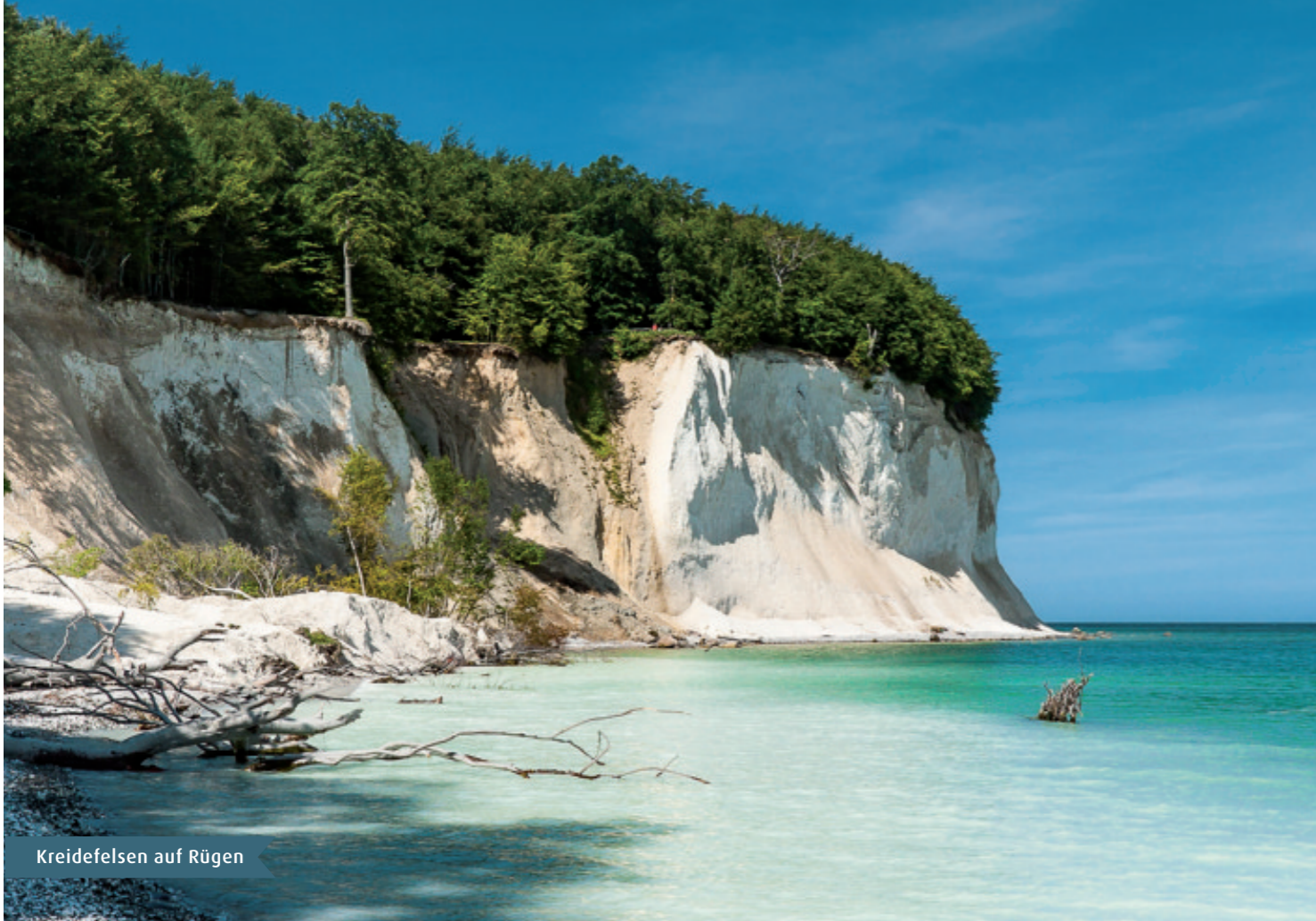
Kreidefelsen auf Rügen

Greifswald ist mit seiner Lage zwischen den beiden Urlaubsinseln Usedom (30 km) und Rügen (40 km) der ideale Ausgangspunkt für Tagesausflüge und Entdeckungstouren auf die Inseln. Zahlreiche Geheimtipps finden Sie in der Region Vorpommern mit ihren Gutshäusern, Fischerdörfern und Flusslandschaften.