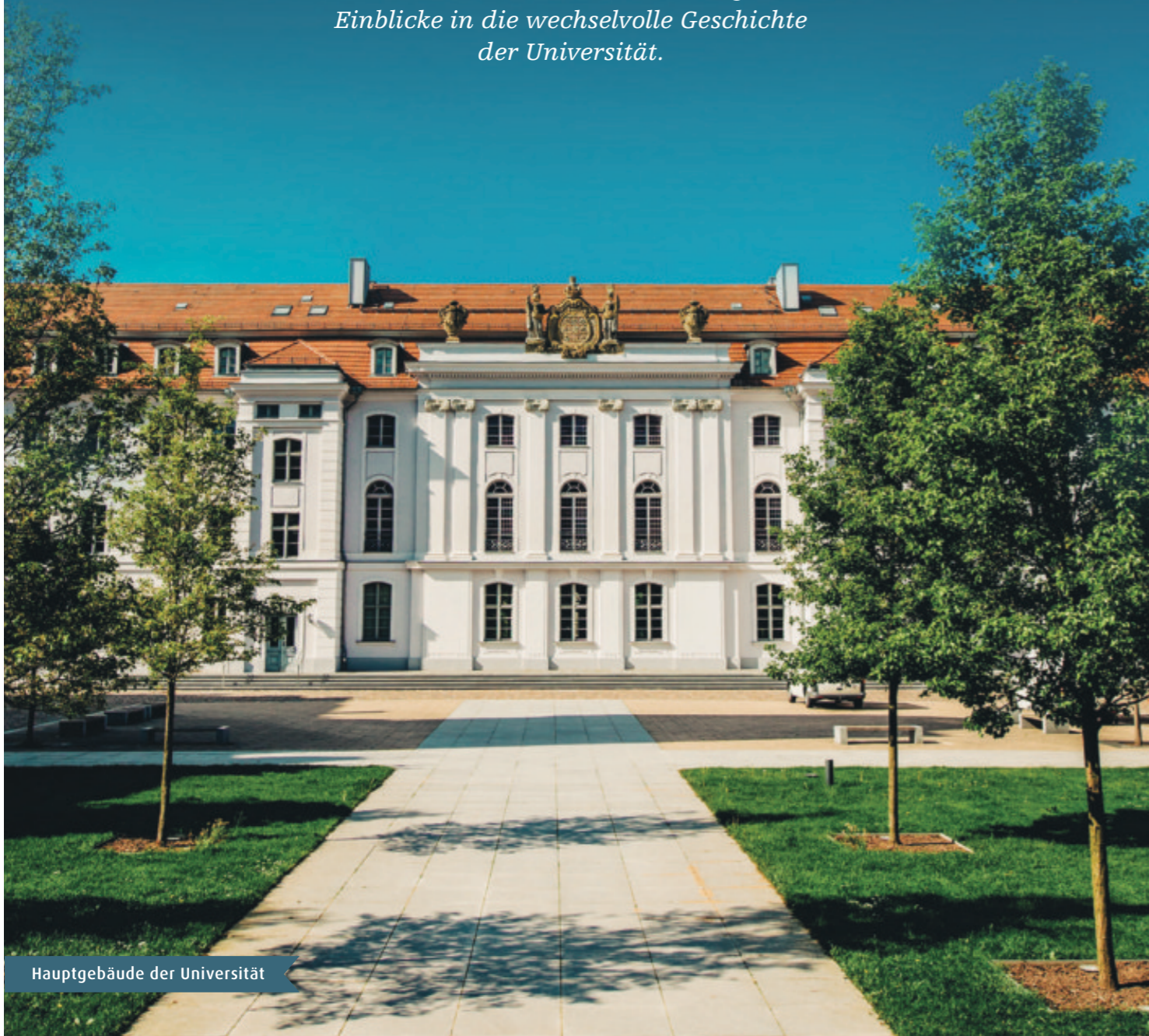
Hauptgebäude der Universität

Die Greifswalder beschreiben ihre Stadt gern als „Universität mit einer Stadt drum herum“. Im Jahre 1456 gegründet, gehört die Universität mit ihren mehr als 10.000 Studierenden zu den ältesten Universitäten Deutschlands. Die barocke Aula sowie der Studentenkazzer geben Einblicke in die wechselvolle Geschichte der Universität.