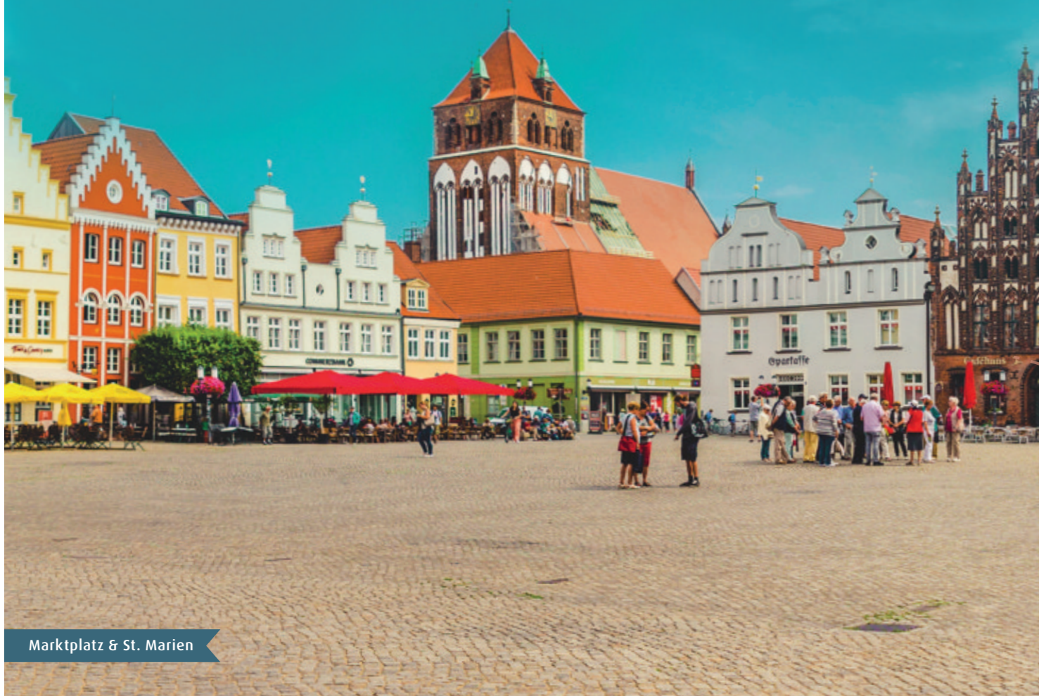
Marktplatz & St. Marien

Die historische Altstadt ist das Herzstück von Greifswald und spiegelt die wechselvolle Geschichte der mittelalterlichen Stadt wider. Nur einen Steinwurf vom Marktplatz entfernt befindet sich der größte Museumshafen Deutschlands. Von dort führt ein alter Treidelpfad entlang des Rycks in das idyllische Fischerdorf Wieck und zur Klosterruine Eldena.